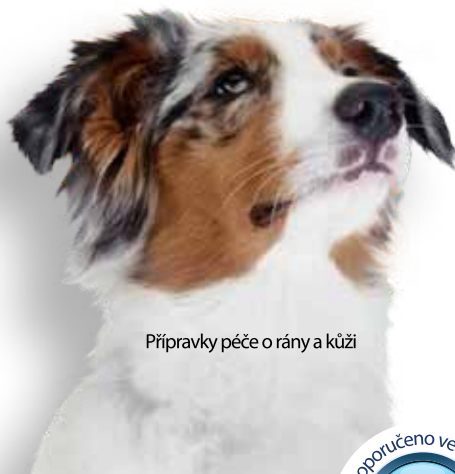
Přípravky péče o rány a kůži

za použití vyspělé technologie na bázi kyseliny chlorné (Advanced Hypochlorous Technology)